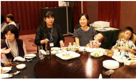
★お子様ランチを用意しました★