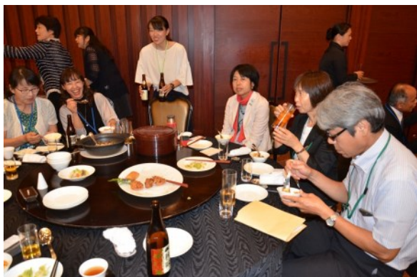
八仙閣自慢の中華料理