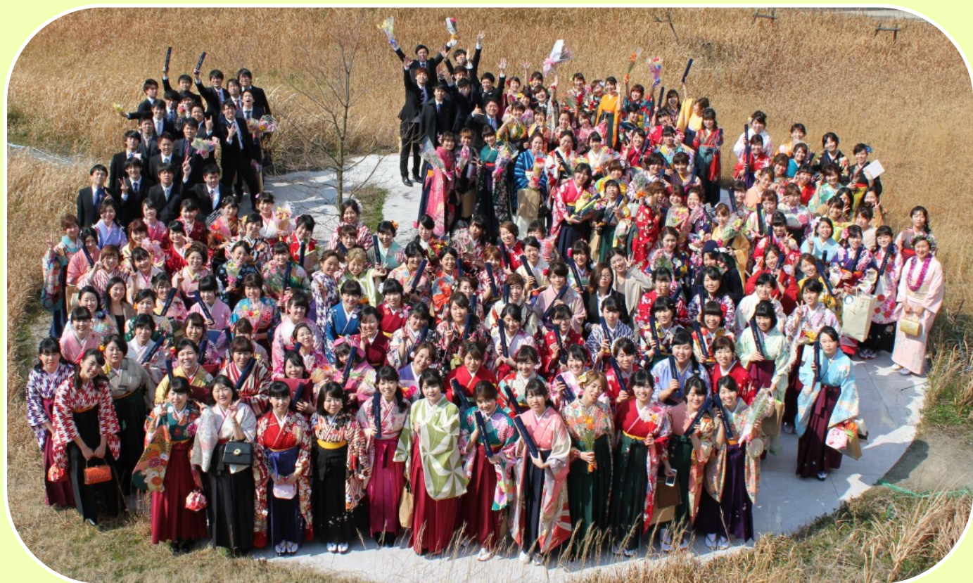
平成29年(2017)3月17日に260名の卒業生が同窓会の仲間に入りました