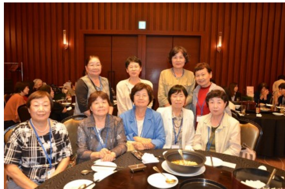
同期がそろったテーブルは一段とにぎやか