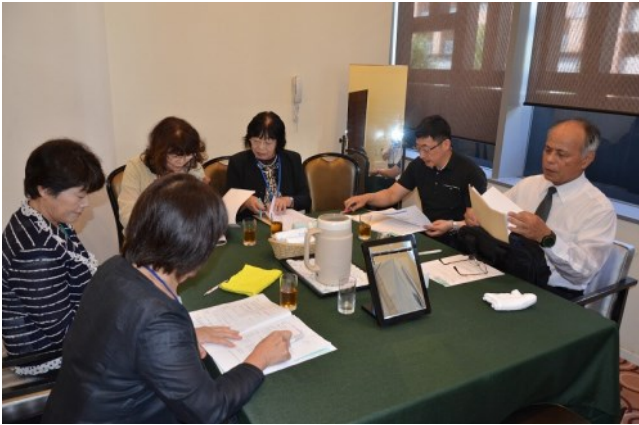
総会前の新旧四役会議

思います。養成所時代は喜んで会費を払う人が多かったと思います。今少し、魅力あるものへとお考えください。