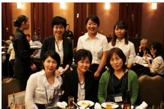
★県看の卒業生と看護学科の学生★