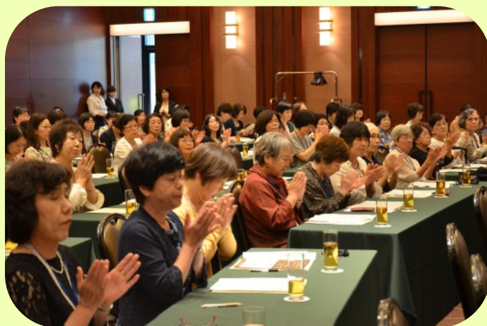
平成29年(2017)8月27日に第27回総会が開催されました