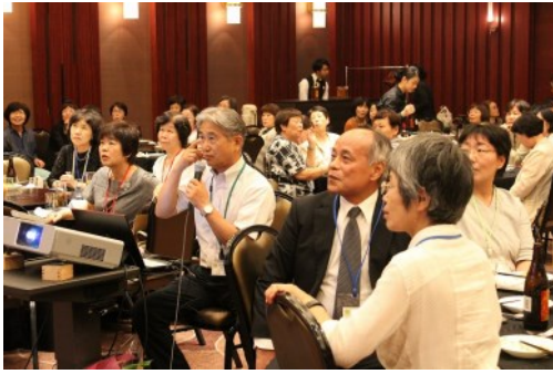
★リニューアルしたホームページの紹介★