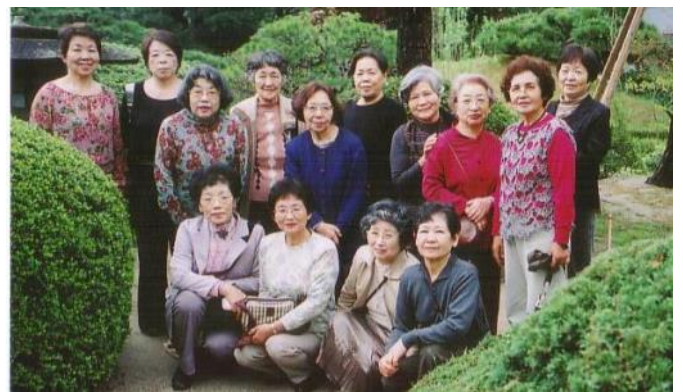
最後の会としての旅二日市温泉大丸別荘の庭園にて

追伸 有志の皆様から通信費として、旅行の際の余剰金をお預かりしておりましたが、残金がでましたので今回出席の皆さんとの話し合いで雑費を引いた残金5万円を同窓会に寄付させていただきました。