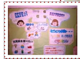
同窓会室の入り口掲示